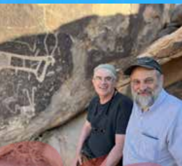
כאן חששנו. לפי המסורת זהו מקום חטא הנגל

התוכנית הזו. לבן-זאיד יש חזון על הקמת עיר ענק חדשה, בשם ניאום, שבעיני רוחו הוא רואה אותה גדולה פי שלושים ושלושה מהעיר ניו-יורק. נכון לעתה ניאום היא עיר על הנייר בלבד והיא נמצאת בדיוק באזור המשוער של הר סיני, במחוז טאבוק. היא תהיה מגה-עיר, לגמרי הייטקיסטית עם משאבי אנרגיה עצמאיים משלה ועם מרחב סחר חופשי.