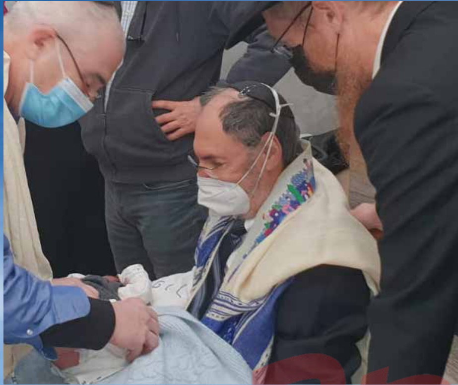
משנים את פני ההיסטוריה. מעמד הברית המרגש

ניסינו לדמיין לאיזה כיוון הם התפללו, ואחר נשאנו תפילה קצרה, אולי באותו מקום בו עמד ישי לפני 1,600 שנה והתפלל על הגאולה האמיתית והשלמה. ■