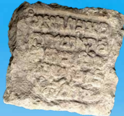
זכרון עמום. כתובת עברית באמצע הרחוב

הענייה ביותר באירופה. באלבניה לא הייתה אנטישמיות בצורה המוכרת, שכן כל הדתות הוחרמו בה: כנסיות, מסגדים ובתי כנסת נהרסו כולם. היציאה מהמדינה נאסרה וכל מה שנתפס כהתנגדות או איום על המשטר - גרר אחריו השלכות קשות.