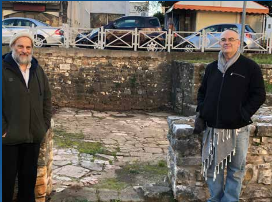
1500 שנה של היסטוריה. ארי וארי בבית הכנסת העתיק

נדהמנו מהעובדה שכל כך הרבה מדינות אירופיות אחרות בהן ביקרנו