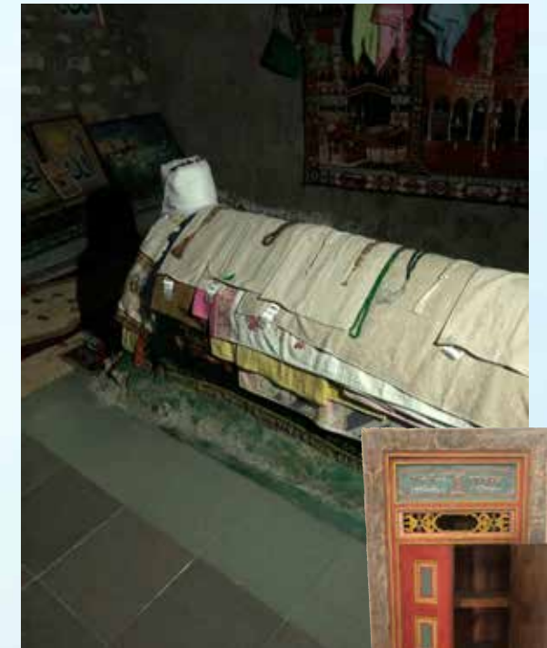
שם רשעים ירקב. האם זה קברו של משיח השקר הזכור לשמצה? המצבה המסתורית בתוך המסגד