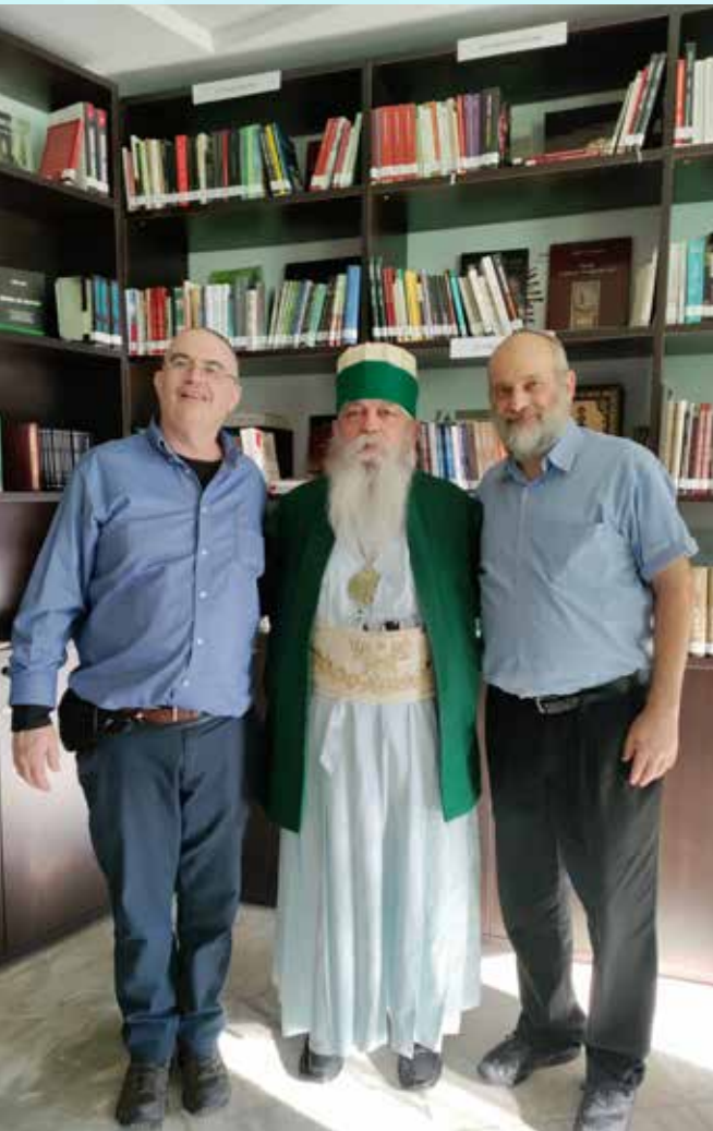
שום רמז לאנטישמיות. בשיחה עם 'באבא מונדי'

אנחנו יודעים, שבתי קברות בדרך כלל נשארים גם אחרי דעיכת חיי הקהילה, אך באלבניה לא הצלחנו למצוא אף בית קברות יהודי.