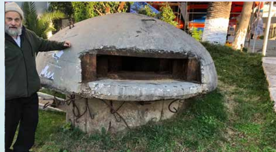
זכר לימי המלחמה. בונקר ששרד מהתקופה הקומוניסטית

בעוד שברית המועצות עצמה האמינה בשמירה על 'שסתום שחרור לחץ', כשהיא מותירה כמה בתי כנסת פעילים ומאפשרת קיום כמה מצוות, כמו אפיית מצות, המדיניות באלבניה הייתה של 'אפס סובלנות'. הם החריבו את כל בתי התפילה של כל הדתות, כולל כל בתי הכנסת ואפילו כמה מבתי הקברות ושלטון הכפירה במדינה היה מוחלט. אבל כל אלה לא הפריעו לנו לחפש.