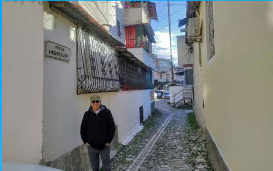
קיווינו למצוא זכר. ביקור ברחוב היהודים

מכל המדינות הקומוניסטיות, אלבניה, שהייתה תחת שלטון הדיכוי הדיקטטורי של אנבר הוקסה במשך למעלה מארבעים שנה, הפכה ללא ספק למדינה המבודדת ביותר, שסבלה יותר מכולן מהמשטר הקומוניסטי האכזר. היא גם הייתה המדינה