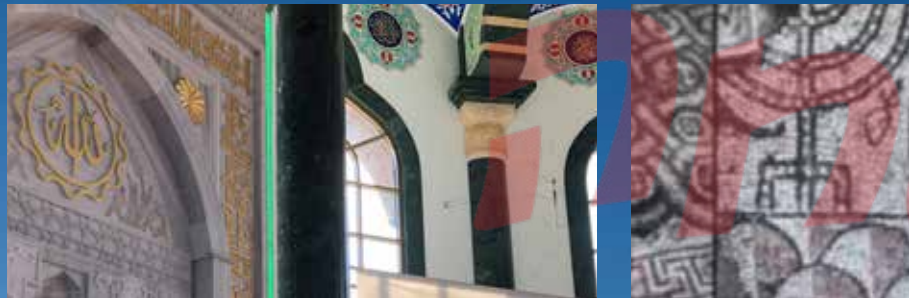
תגלית מפתיעה. חלקי הפסיפס שנחשפו

שנה), עשרים אחוז כנוצרים דתיים, ועשרה אחוז כקתולים, למרות שרובם אינם דתיים. זו הסיבה שהופתענו לגלות שבעיר הבירה טיראנה נמצא המרכז העולמי של התנועה הסופיסטית האסלאמית, הידועה בכינויה 'בקטאשי'. הסופיזם הוא זרם באסלאם שחבריו נחשבים לאנשים רוחניים, חושבים, בעלי מבט המופנה פנימה, ושונים מאוד מהמוסלמים שאנחנו מכירים. אלו אנשים שלווים, מודרניים, אוהבי שלום, המקבלים ומכבדים כל אדם.