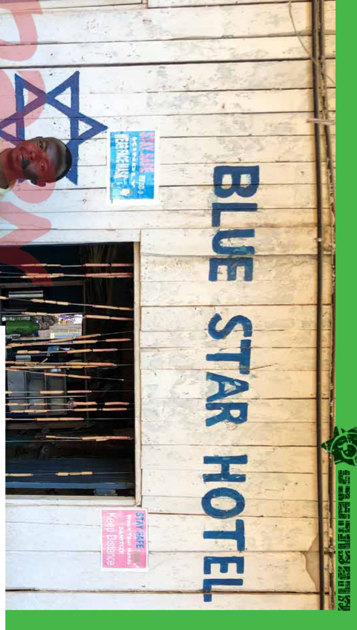
איכיל את המלון הם קוראים גל שים, אמנת היהודים, בית המלון כוכב כחול

נכנסה קניה למנה, ואנחה נאלצנו לדרות את הבקור לקיין. הפנים, בגלל סיבות טכניות שונות, נסעתי לכה: ארי זרביטובסקי נחה מחוקה.