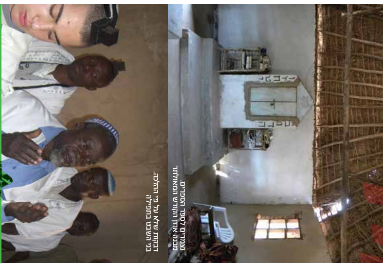
מסדרים לסיני המסידים, המבנה אין החודש המאלולר