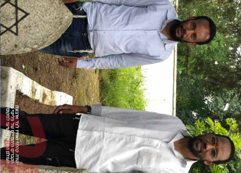
יחידת הנדסה וחשמל לצור ארבעות חשמליות ביישובים של כלישיע, תלומות והחלום השנייה שהגיעו לתלמים

כשרת הכנסת הוות וספר החווה שרת. חוסר היציבות, המציאות, האווירה האנטי-ישראלית והלאמת האומרת במקרה הפיכה של טעויה למדינה עצמאית רבנות בשנת 1961), רצו להחיות רבים לעזות את המדינה בעת אלה שנותנו בה ירוד למחלת והסחיה את הוהם החיות חלקים אף בור ליות בקרב שטב מאטאית הוהד. שם הם חשד בנחות יוה שיל יתגל.