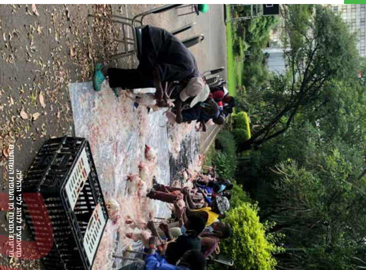
הדאמניצ'א לנדות לפי החלכה, לז-עית' המטות' מן המוסדות השויהים

בן השקופרה של הביטחון קצת מנוחלת רוב החברים והוא את עצמם ונצרים יהודים גם היה לנכונה השויה של הזי שאנש משני. יש המשיש מנינים בל רחוב קינן, עם ללעלה מ-8,000 חברים, מבלי לבזן זאת, אחר שיבוא לביקור באחד המורים והלז עשוי לחתבלל: ▶