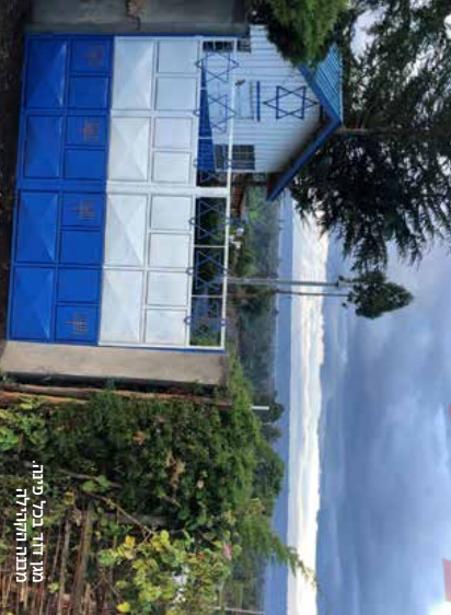
מגן דוד בלבד בית.

קולנו מאוד מבטירה פנים קולני קומר על כי שאף אחד לא בוא ברוב לבת הכנסת בשבת ובמותו. לצורך כך הוה רכש שטח ארומ סמוך לביתו. שם הוה מקם אוחלים עבור אוהו השבת והוחים, בעוד אשורו ארודות על הבישולים. למרות שחלק ממירד הקהילה עברו לעקמות נרולים ומסיסים יהוה בם עם מדינת ישראל, קולני אומה שלעת עוה, כל עוד הקהילה זקוקה לי, הוה שאף במקום. כיו לתומה את אשורו ממו שער הוה אר שאף עקר עם אדמוז הו שמשותף חגיסו" – שיתופים לוחוה" – כיו לקבע חבורתו יומית עם אי קולנו וזכו למסור.