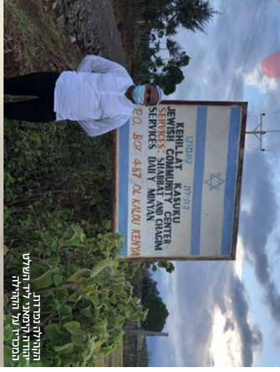
מקהילת נבחרות יהודי וחסידים ליד השלטת המבסדי על הקהילה