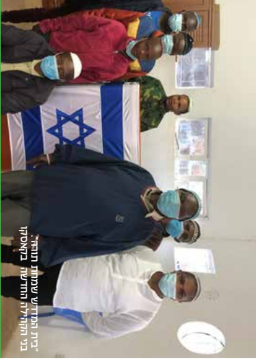
בי"ד המודיש שמות תורה" בית החירות החתונה באקסוקי

מגד אחד הוא ריאה שכל מניג דת, אילם חתבת על שם "רז'על" ושיל המכונן לעבר בית הכנסת.