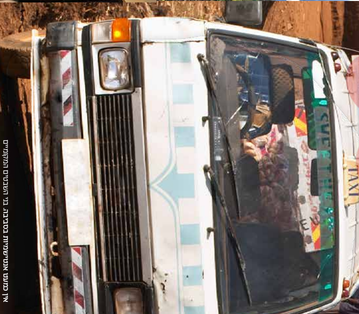
אי כבעתו אנטרנטיות מסביבנו: בי השבטים התלומים

להישאר כל השנים האלה מנות לרדאו ונודר בטנונהו ויחיה שם קולנו קטנה ובלתי ידועה של יהוהים תמנים שבנותו השמונים של המאה ה-19 וחו את ספרי ערד אל מורה-אנהק. חלקם ירוד דודמה, דוד אחיפיה קנה, והחיישבו בטנונה של קמו, בחפשים אחר חודמויות כלליות טובות יוה.