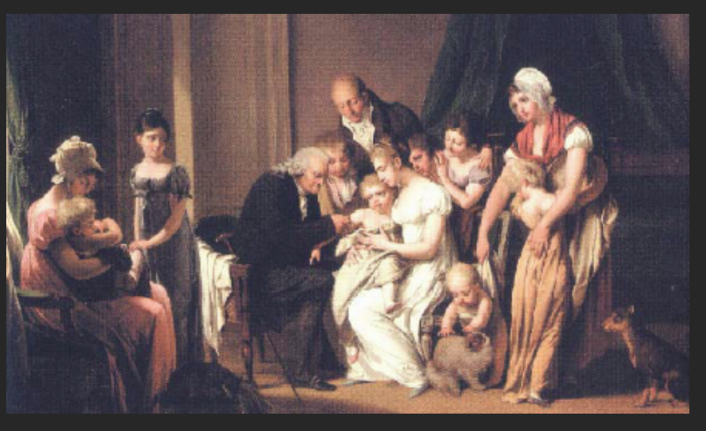
Louis-Léopold Boilly- 1807