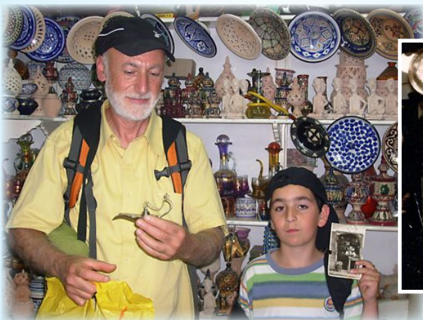
הביקור המרגש ביותר: בחנות שהיתה של סבי. אני אוזח בידי את תמונת סבי עובד בחנותו, ואתם יכולים להתרשם ממנה בהגדלה