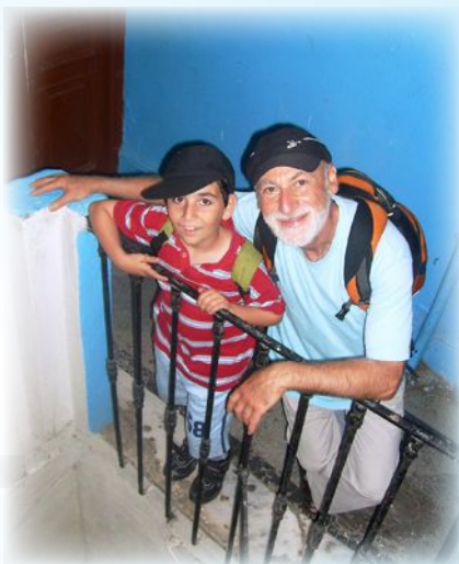
אני ואבי עולים במדרגות לבית שבו גדל ואותו עזב בהיותו בן 10, כמוני

אני חושב שחשוב מאוד ללמוד על השורשים, וכל ילד צריך לדעת מנין הגיעה משפחתו ומהם שורשיו.