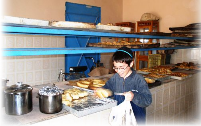
ילד צעיר נשלח לאסוף את החלות שאפתה אמו לשבת בתנור הקהילתי. שימו לב למגשי החלות השייכים למשפחות אחרות ולסירי החמין שיוכנסו לתנור הקהילתי לפני שבת

שמו, איש זקן ועדין למראה, חבש לראשו תרבוש אדום מסורתי. הוא השגיח בקשיחות על הפועלים, וכעס עליי בכל פעם שניסיתי לצלם אותו, משום שהאמין כי הצילום מביא "עין הרע". העובדים היו ידידותיים מאוד. אחד מהם הזמין אותנו לארוחת לילה מאוחרת, עם סיום האפייה. ביתו היה במובנים רבים כולו ברחוב, מאחר שהנשים הוציאו הכל כדי לקרצף ולנקות לפסח, מה שלא הפריע לו לשים קצת כבוד על האש עבורנו.