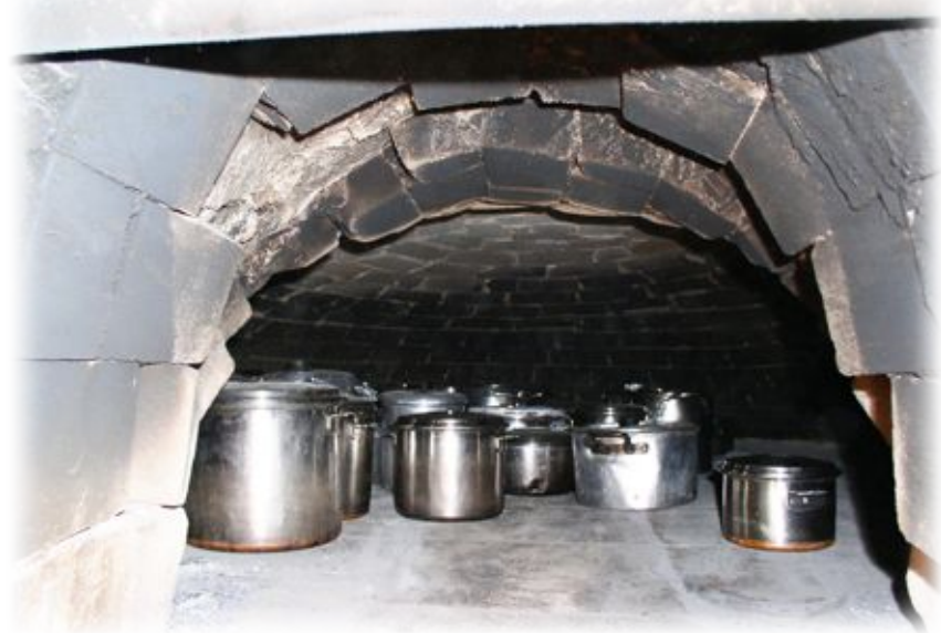
כנראה המקום האחרון בעולם שבו עדיין עושים זאת: מדי ערב שבת מכניסים יהודי ג'רבה את סירי החמין לתנור הקהילתי, אוטמים אותו, ובשבת בבוקר מוציאים את הסירים לכבוד הסעודה

ליהודי ג'רבה יש תנור קהילתי, שבו הם אופים את החלות מדי יום ישיש, ומביאים את סירי החמין כדי שיישארו חמים כל הלילה בתנור המשותף. הם לא צריכים לעשות זאת, שכן לכל משפחה יש תנור משלה, אך הם מבקשים לשמר בכך את המסורת העתיקה. זה כנראה המקום האחרון בעולם שבו זה עדיין קורה. כל משפחה שולחת מגש חלות הקלועות בצורות מיוחדות ושונות, ומישהי אמונה על