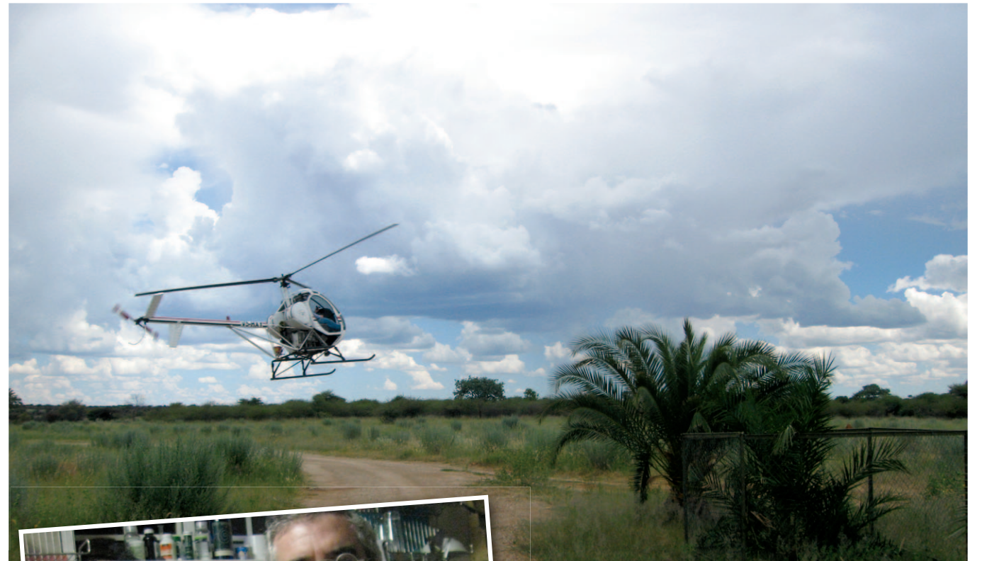
עלינו למסוק וזכינו למבט אל נמיביה ממעוף הציפור. המסוק רגע לפני הנחיתה