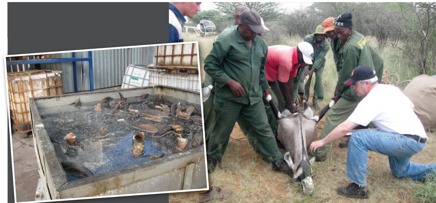
קדניים באורך מטר. השופרות בבריכת העיבוד

כשנכנסנו דרך השער הנעול לבית הכנסת הבחין