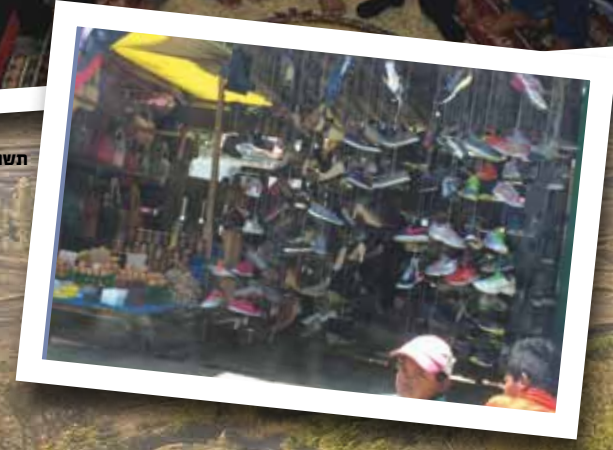
תשוקה ליהדות וחוסר הבנה. עם בני הקהילה