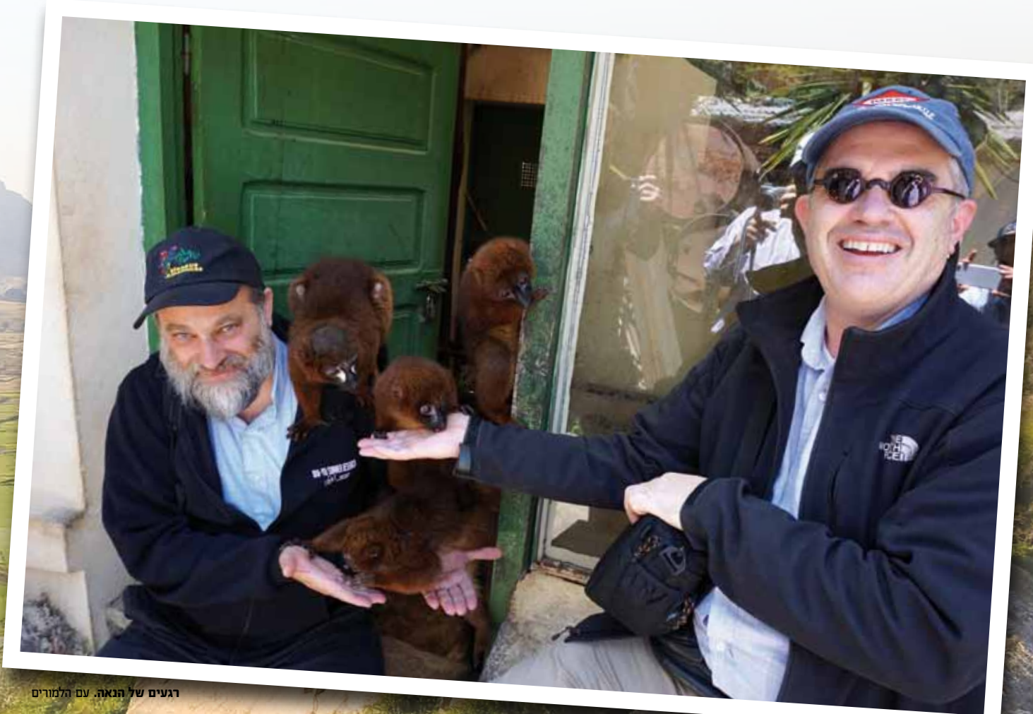
רגעים של הנאה. עם הלמורים