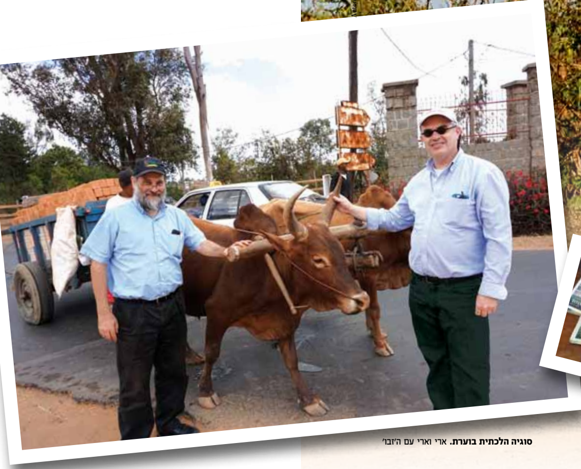
סוגיה הלכתית בעורת. ארי וארי עם הזבר