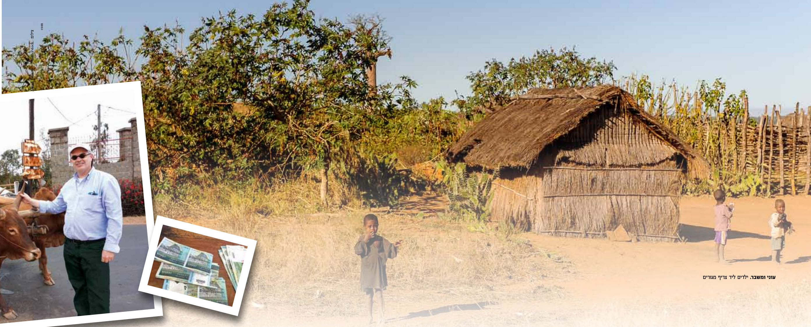
עוני ומשבר. ילדים ליד צריף מגורים