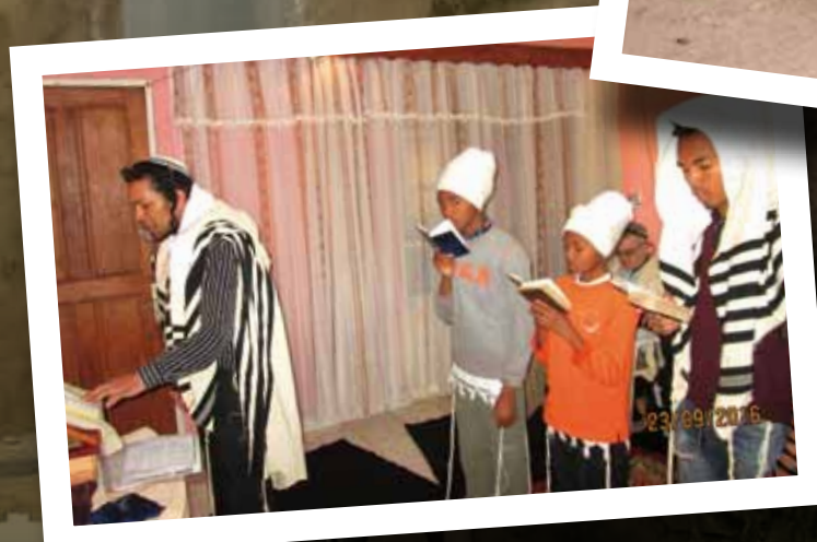
פתאום קם אדם בבוקר ומחליט להיות יהודי. ארי וארי עם מנהיגי הקהילה (ברקע נופי האי)