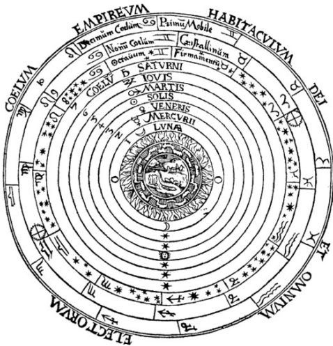
Schema huius præmissæ diuifionis Sphærarum.