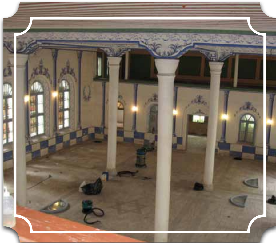
מנקים את בית הכנסת לאחר שנים רבות

פגשו יהודי מימיהם. אין להם מושג למה צריכים לשנוא יהודים, אבל מנהג אבותיהם בידם... יחד עם זאת השנאה הקסנופובית אינה מכוונת רק כלפי יהודים. גם הצוענים מהווים יעד להתנכ" ליות, בפרט לאור העובדה שבשנים האחרונות קיימת תופעה של התאסלמות בקרב הצוענים והם חשודים בקיום קשרים עם קבוצות ג'יהאד.