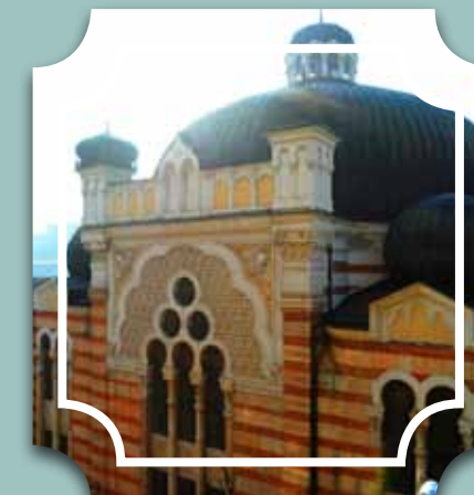
בית הכנסת בסופיה

בשעה 7:00 בבוקר הוא מתחיל בסבב טלפונים לכל יהודי שגר בקרבת מקום ומברר האם הוא יגיע לתפילת שחרית, ובדרך כבר מדרבן גם למנחה ומעריב. "היום ראש חודש כסליו ותהיה לכם מצווה מיוחדת", לואט הרב ליהודים אשר ידיעתם ביהדות שואפת לאפס. היהודים בסופיה מכבדים מאד את היהדות ומנהיגיה, ומשתדלים מאד להתייבב בבית הכנסת לפני יום עבודה עמוס ותובעני. השמחה המאירה את פניו של הרב מעידה על הצלחתו לארגן מניין לתפילת שחרית של ראש חודש בארץ נכריה.