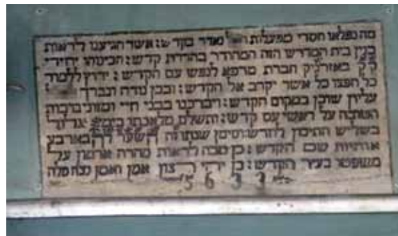
בית מדרש שהפך לבית קפה ובלחץ הקהילה היהודית חזר לפני שנה לייעודו המקורי

לאחר המלחמה נמנו בעיר שמונה מאות יהודים. רובם עלו לארץ מיד בקום המדינה (הישוב בית חנן הוקם בידי יוצאי פזרד'יק). בשנת תש"ט נמנו רק מאה שמונים ושלושה יהודים בעיר, ומאז מספרם הלך והתמעט.