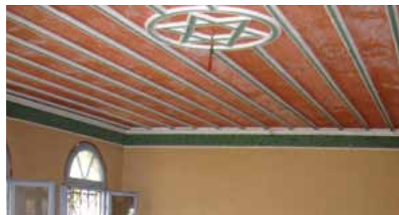
תקרת בית כנסת בבולגריה