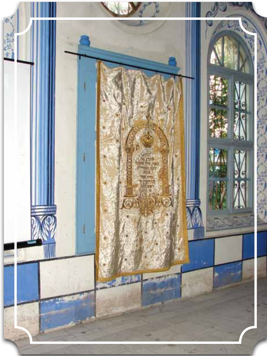
בשעה שתלינו את הפרוכת על הארון נפל הס. הפרוכת המקורית שעטרה את ארון הקודש בפזרד'יק