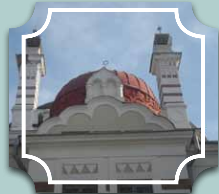
בית הכנסת בסופיה