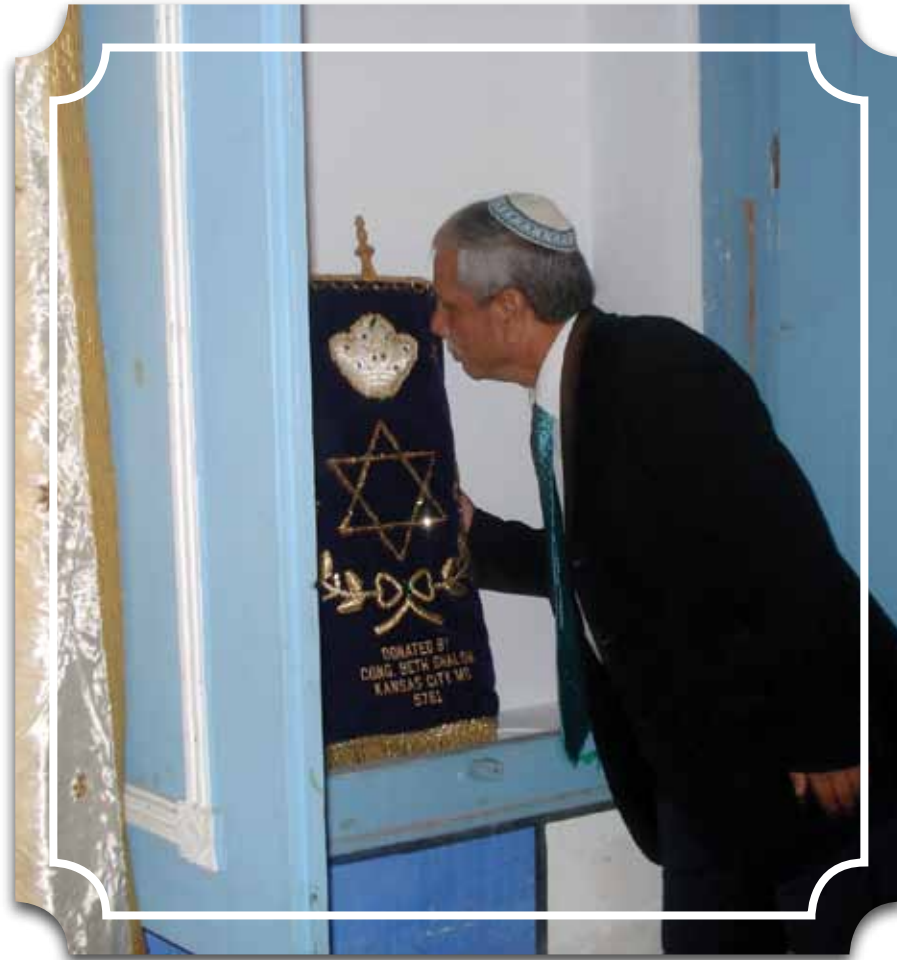
שגריר ישראל בבולגריה בבית הכנסת בפזרדז'יק