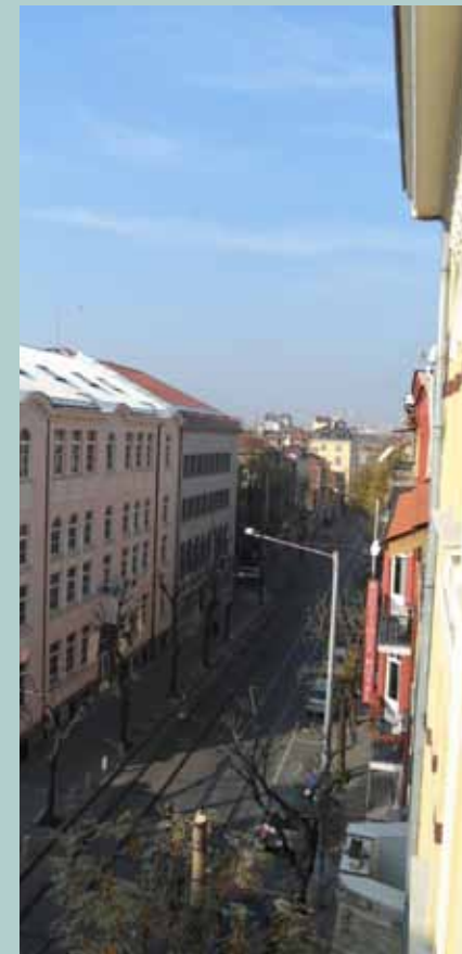
מראה כללי של בולגריה

הרב והרבנית זרביב לבולגריה, הוא מסיבות ראש חודש ושיעורי יהדות בנפרד לגברים ולנשים ב"בית שלום".