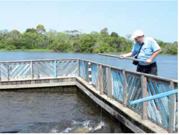
האם הפייץ? כשר? ארי וארי במסע דיג בעקבות הדג הנעלם